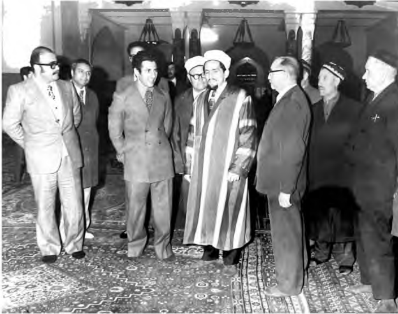
اجتماع لعبد السلام جلود مع عدد من القيادات الإسلامية في إحدى جمهوريات الاتحاد السوفياتي.